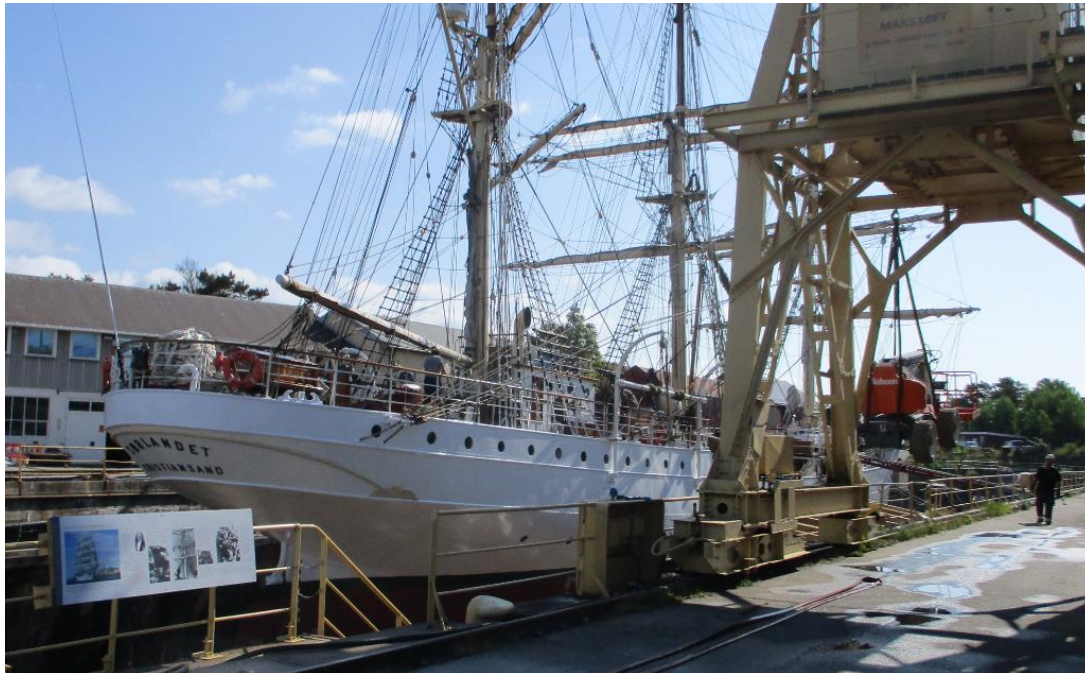
Fra Bredalsholmen Dokk og Fartøyvernsenter. Fullriggeren Sørlandet ligger i tørrdokk for oppgradering. Juni 2023.

Kvadraturen er en av de best bevarte renessansebyene i Europa og er registrert av Riksantikvaren som kulturmiljø og landskap av nasjonal interesse (som erstatter NB- eller registrert over nasjonale interesser i by). Det karakteristiske rutenettet som byen er regulert innenfor er godt bevart.