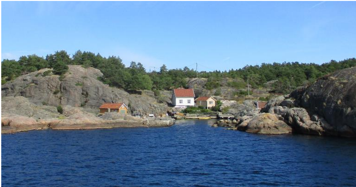
Det er nok mer skog i dag enn for hundre år siden, men husene ligger lavt i terrenget og lunt inne i bukta, akkurat som Helland beskriver dem i 1903

Amund Helland forteller i 1903 at sett fra havet fremstår landskapet skogløst, med grå, ikke spesielt høye koller, og bak dem ser man at høyere åser eller heier hever seg, uten at de synes å utmerke seg enten ved høyde eller form. Det tilsynelatende øde land ute ved kysten forandrer imidlertid fort karakter når man kommer inn i bukter og fjorder. Her åpner det seg på mange steder, gjemt mellom knausene, ofte vakre, til dels yndige bebygde strekninger, ofte med frodig løv- eller furuskog. Lenger inn i landet skjærer dalførene gjennom landskapet. Mellom dem ligger heier med sidedaler og forsenkninger, der det ofte ligger gårder. I lune kroker vokser furu og bjørk, men også eik og hassel, trinnvis frodig rundt gårdene med lysegrønn dyrket jord og blomstrende rosebusker 12 .