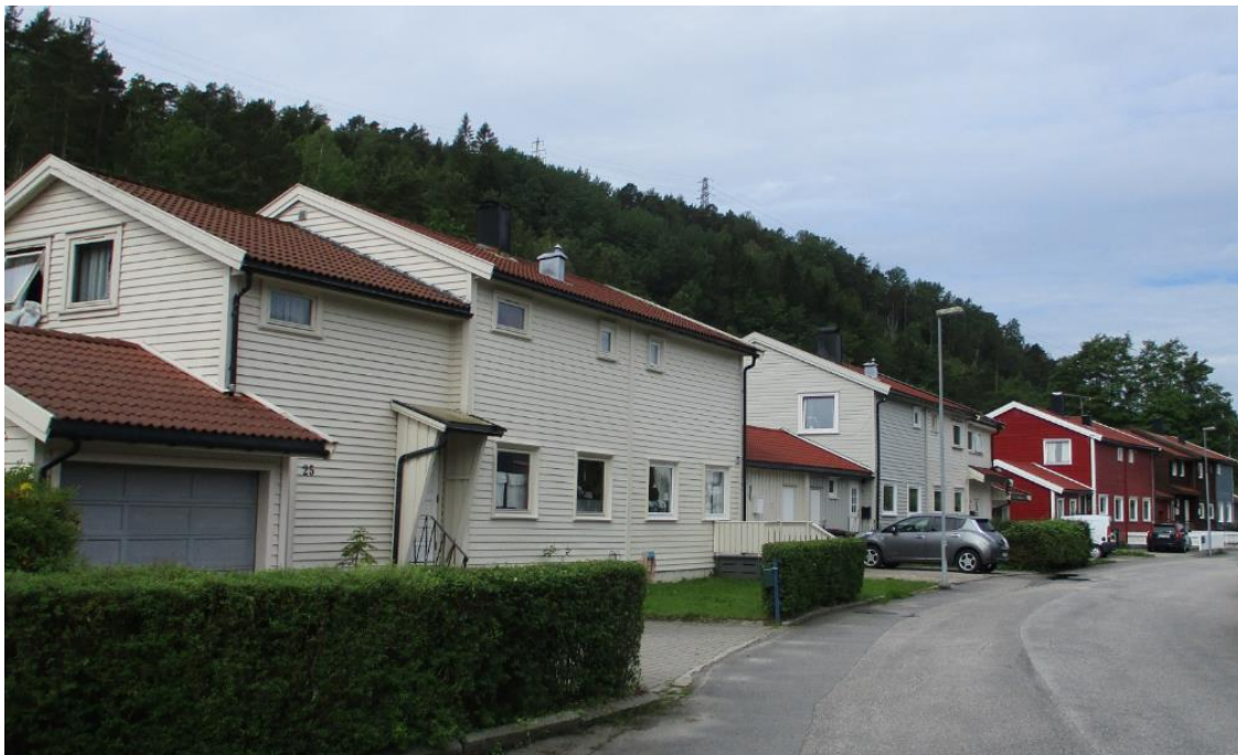
Boligområde fra etterkrigsårene, da Kristiansand var landets raskest voksende by

Kristiansand har fortsatt gateløpene og kvartalene planlagt av Christian IVs ingeniør Hans Jacobsen Schiørt. Byen har dessuten Europas største sammenhengende trehusbebyggelse. Murbyen er et interessant eksempel på sen historisme, Enrum et praktexemplar på boligområde bygget etter det engelske hagebyprinsippet.