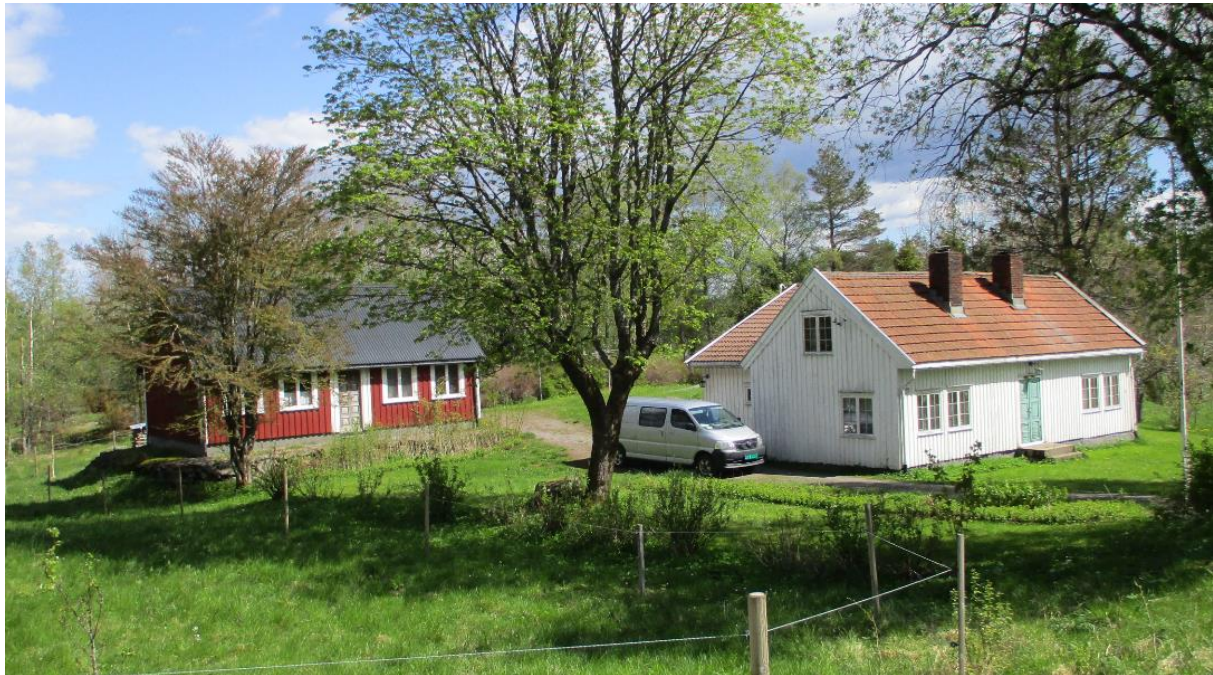
Fra Røysland, et av områdene inkludert i temakart kulturmiljø for Songdalen kommune vedtatt i 2012.