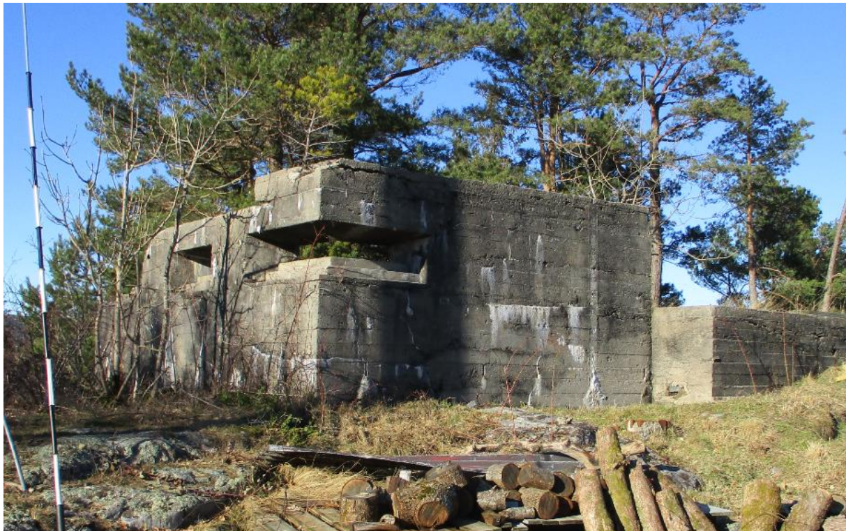
Kulturminner kan være verdifulle på grunn av viktig arkitektur og kunst, men verdien kan også ligge i historien de vitner om. Bildet viser en skytterstilling fra annen verdenskrig på Justnes.

Det er et nasjonalt mål at et mangfold av kulturmiljø skal tas vare på som grunnlag for kunnskap, opplevelse og bruk. Disse begrepene danner grunnlaget for verdivurdering av kulturmiljøer.