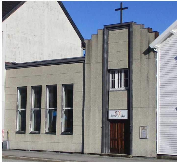
Kristiansand har et stort antall kirker, både tilhørende Den Norske Kirke og andre trossamfunn. De kjennetegnes av stor arkitektonisk variasjon og utgjør en viktig kulturarv.