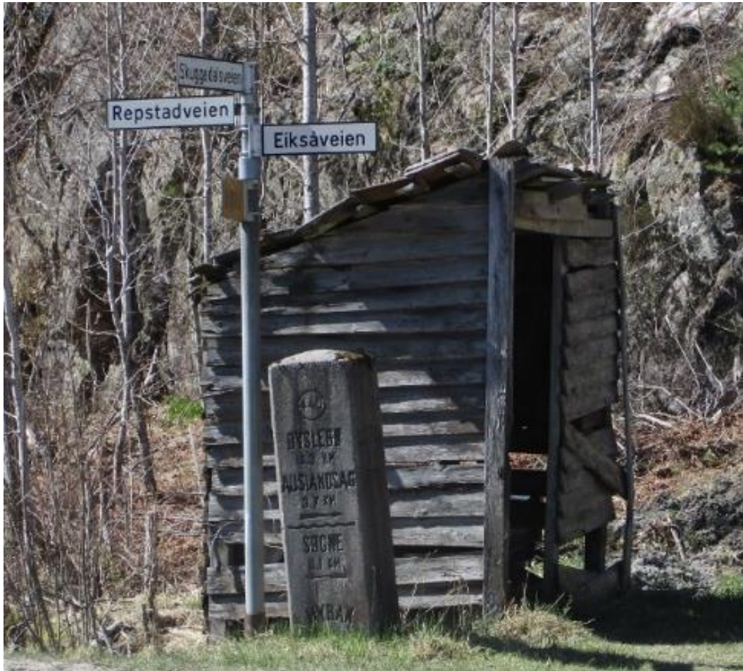
En melkerampe, en gammel milepæl og et nyere veiskilt forteller mye om nye og gamle stedsnavn og næringsgrunnlag. Vi er ved Kimestadvannet langs en av de gamle ferdselsvegene mellom øst og vest.