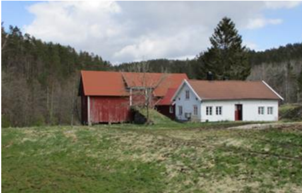
Høy verdi: autentisk, godt bevart, sammenheng mellom kultur og natur. Bildet viser heiegården Lia øst for Songdalen