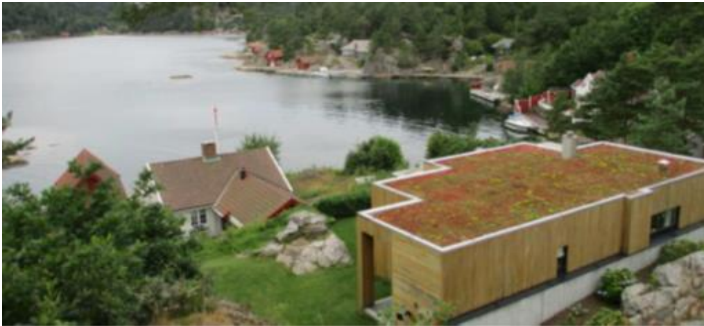
Bygningen til høyre bidrar ikke til helhet og sammenheng i dette miljøet.