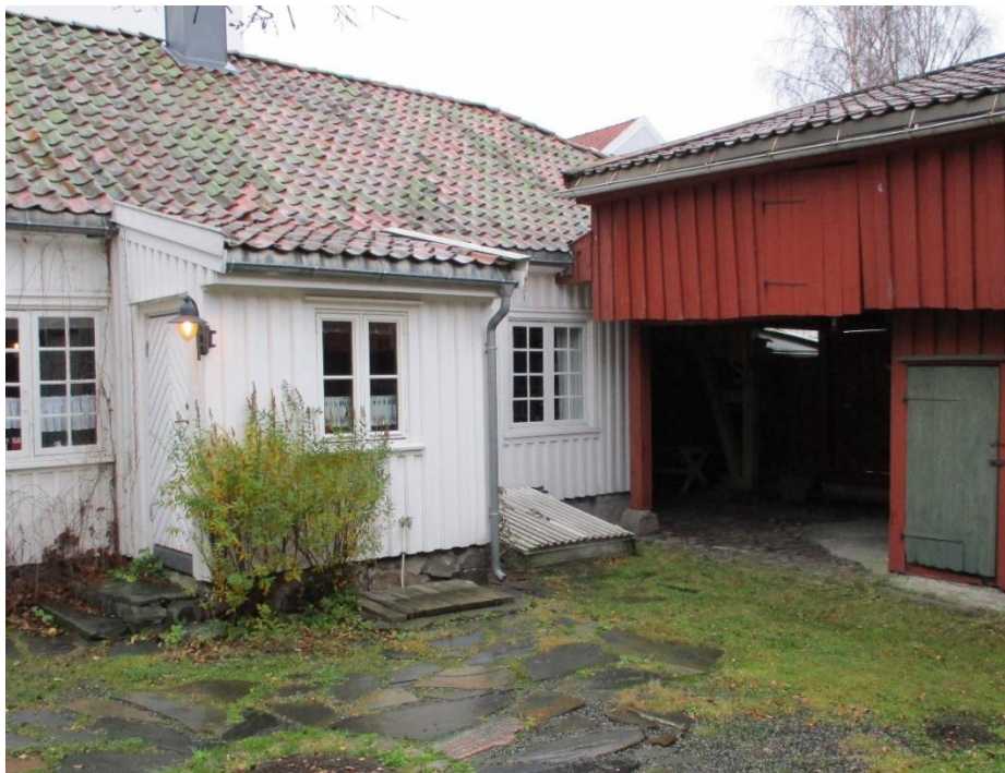
Bakgården til Bentsens Hus, et av de best bevarte gamle trehusene i Kristiansand og en viktig møteplass for kulturminneinteresserte

Lokale kulturmiljøer er stedets hukommelse, de vitner om byggeskikk, næringsgrunnlag, naturlige ressurser, forhold og samfunnsutvikling.